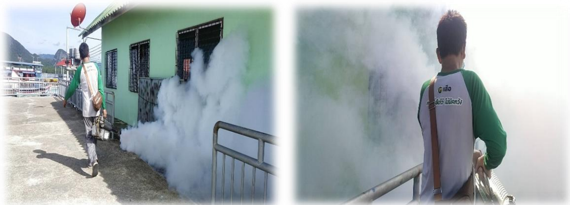
๑๘. โครงการเฝ้าระวังและป้องกันโรคติดต่อ (โรคอุบัติใหม่ โรคอุบัติซ้ำ)